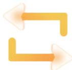
Modo de desplazamiento