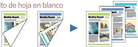
Dos documentos con una cara en blanco Hojas blancas no son escaneados