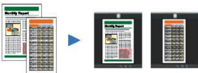
Hojas de diferentes tamaños Tamaño ajustado automáticamente